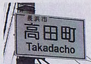
▲旧長浜市の「高田の辻」