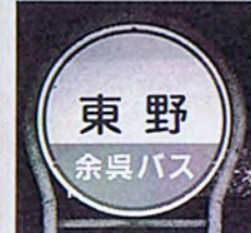
▲余呉バス「東野」は余呉町