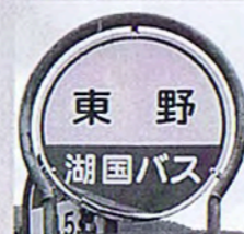
▲湖国バス「東野」は旧浅井町